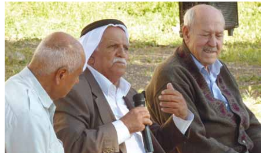
Juden und Palästinenser in Galiläa: „Gemeinsam im Schmerz und in der Hoffnung“

„Bis einhundertundzwanzig“ formuliert der traditionelle jüdische Geburtstags-Glückwunsch. Wir hoffen und beten, dass gerechte und friedvolle Koexistenz zwischen beiden Völkern in diesem Land früher als in fünfzig Jahren möglich und länger als einhundertundzwanzig Jahre währen wird.