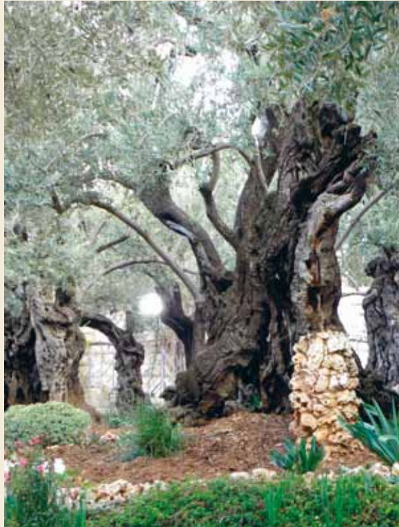
Ölbaum im Garten Gethsemane